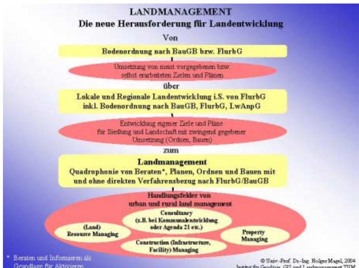
Abb. 3 LANDMANAGEMENT – Die neue Herausforderung für Landentwicklung

Angesichts der von den Kommunen erwarteten Hilfe und der europäischen und nationalen konzeptionellen Rahmenbedingungen muss die Landentwicklung ihren Kurs „weg vom Verwalten hin zum Managen“ fortsetzen. Dabei geht es nicht um ein Entweder Oder, sondern um Beides: Einerseits um eine kraftvolle Wahrnehmung ordnungsorientierter Aufgaben und andererseits um das Angebot und die instrumentelle Bereithaltung von ganzheitlich-systemischen, von Governance-Prinzipien durchdrungenen Entwicklungsprozessen . In einem Forschungsauftrag für die Bayerische Flurbereinigungsverwaltung hat der Autor dieses „sowohl als auch“ als Weiterentwicklung zum Landmanagement mit der Quadrophonie von Beraten, Planen, Bauen und Ordnen bezeichnet (s. Abb. 3) (Magel 2002).