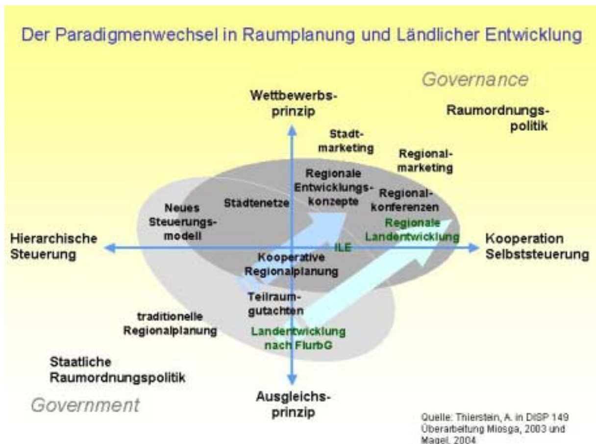
Abb. 1: Der Paradigmenwechsel in Raumplanung und Ländlicher Entwicklung

Bevor auf die neuen Herausforderungen für die Kommunen eingegangen wird, soll zunächst in Erinnerung gerufen werden, was seit einiger Zeit die Paradigmen und Methoden der herkömmlichen Raumordnung und Regionalplanung durcheinander schüttelt (siehe Abb. 1) und was in Stichworten wie folgt zu charakterisieren ist: